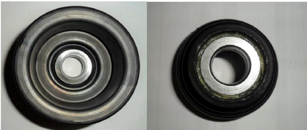
Fig. 06 – Rolamento alinhado na coifa ( Interno e Externo)

Utilizar ferramenta adequada para fechamento da abraçadeira que fixa o rolamento na peça e recomenda-se a troca do rolamento toda vez que houver substituição da coifa.