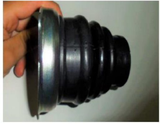
Fig.08 POSIÇÃO CORRETA

5ª - Ao montar a coifa com a flange não utilizar colas ou produtos químicos para auxiliar no assentamento, no momento da aplicação o semi eixo deve estar alinhado (Fig. 9).