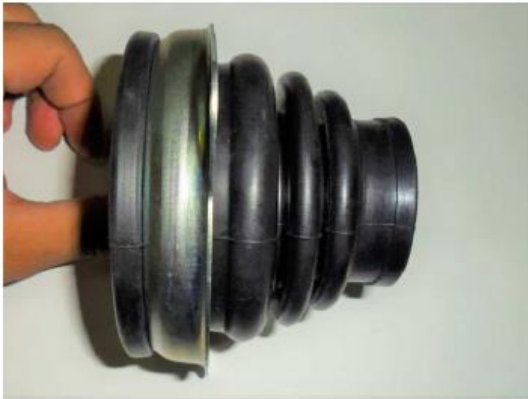
Fig.07 POSIÇÃO INCORRETA

DICA: O aperto dos parafusos da flange devem ser feitos de maneira uniforme (Ex: Aperto de cabeçote), evitando o mal assentamento da mesma na caixa.