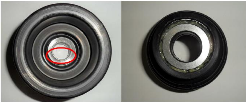
Fig. 05 – Rolamento fora de alinhamento na coifa ( Interno e Externo)

3ª - Verificar se há sinais de mal assentamento do rolamento na coifa interno e externo (Fig. 5 e 6).