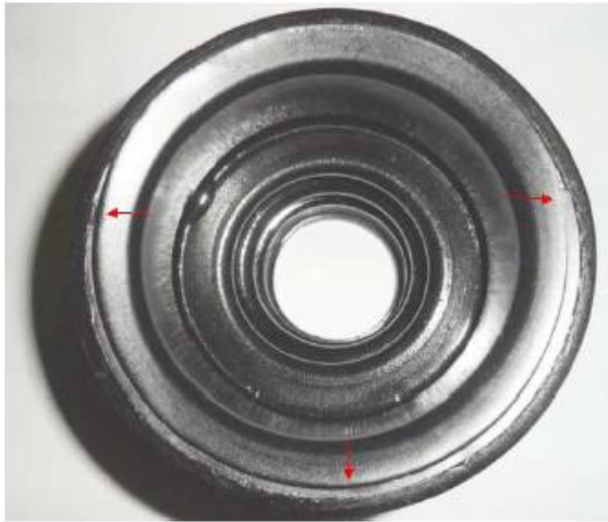
Fig. 10 – Assentamento Incorreto

6ª - Soltar a junta Homocinética lado roda. É muito importante que nenhuma parcela da coifa fique sem contato assim evitando vazamentos (Fig. 10 e 11).